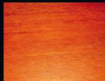
TEX OLJE 2