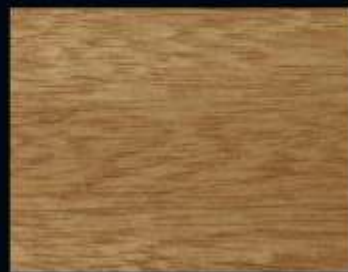
LEGNÒ NON TRATTATO

*Le tonalità delle finiture qui illustrate possono variare in base al tipo di legno impiegato e al suo stato e sono puramente indicative trattandosi di una stampa.*