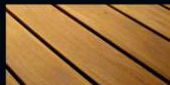
DURANTE IL TRATTAMENTO