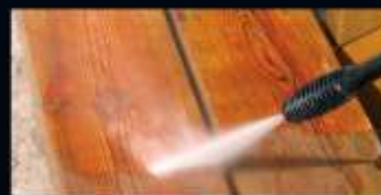
DURANTE IL TRATTAMENTO