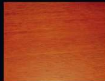
TEX OLJE 1